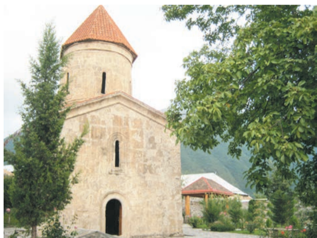
Древний христианский храм в селе Киш

В Химках победу одержала ученица 9 «А» клас-