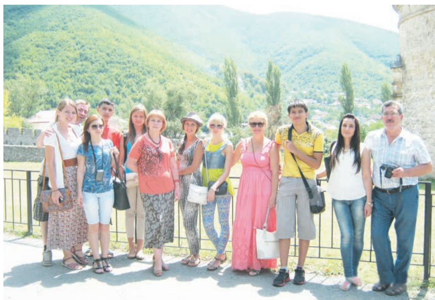
Победители конкурса «Азербайджан глазами российских школьников и студентов»

Владимир Григолая